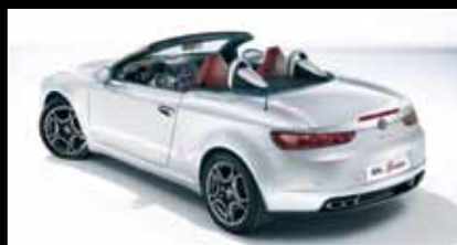
Der Alfa Romeo Spider. 1750 TBI ab € 40.590,-