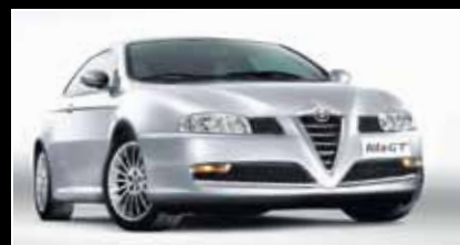
Der Alfa Romeo GT. Ab € 30.700,-