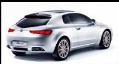
Der Alfa Romeo Brera. 1750 TBI ab € 37.590,-